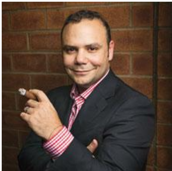
Carta del CEO Plasencia Cigars, S.A