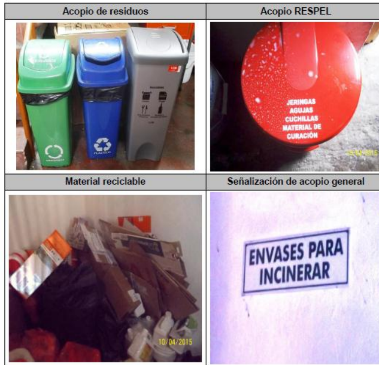
Ilustración 5 Residuos generados

FUMIGACIONES INDUSTRIALES LTDA., no genera emisiones puntuales al aire, por la prestación del servicio de fumigación terrestre en domicilios, empresas y otros espacios; sin embargo se pueden presentar emisiones fugitivas en el proceso de dosificación de los productos químicos utilizados para el servicio, el cual es controlado mediante adecuadas prácticas de dosificación de los productos tanto líquidos como en polvo y mediante la implementación de los Elementos de Protección Personal – EPP. Cabe resaltar que la adecuada dosificación se presenta por los procesos de capacitación que brinda la empresa.