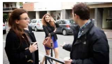
Épisode 2 - Chacun son handicap