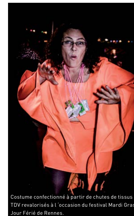
Costume confectionné à partir de chutes de tissus TDV revalorisés à l'occasion du festival Mardi Gras Jour Férié de Rennes.

Depuis septembre 2015, le partenariat entre TDV Industries et Breizh PHENIX a permis de revaloriser 8,3 tonnes de tissus invendus au profit de 8 associations (Perlucine, Le village d'Alphonse, Le Truc, La boutique solidaire de Pipriac...) Ces associations sont essentiellement des organisations d'insertion qui permettent le retour à l'activité de personnes éloignées du monde du travail. Les tissus sont notamment utilisés pour la confection de décors, de costumes, de réemploi solidaire ou encore lors d'ateliers de couture.