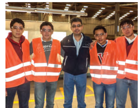
Programa "Comprometidos con la Sociedad Estudiantil"