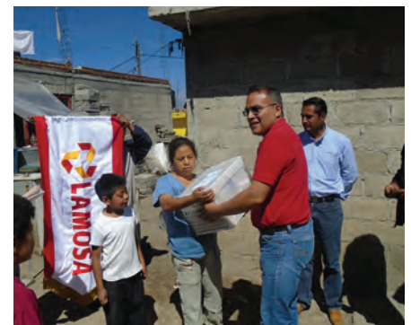
Apoyo familias en San Luis Teolocholco