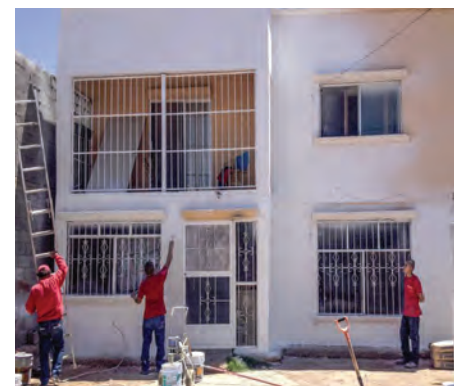
Mejoras Casa Hogar "Ángel Guardián"