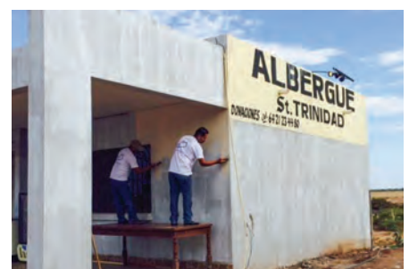
Mantenimiento albergue "Santísima Trinidad"