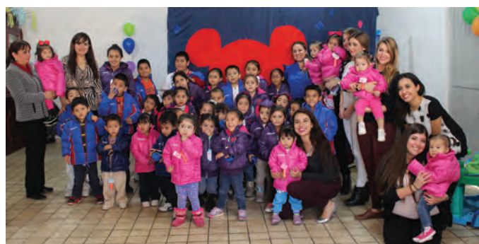
Convivencia personal Lamosa con niños del CAYAM

Los negocios del Grupo desplegaron objetivos concierne a la implementación de proyectos de voluntariado y de inversión social para apoyo a las comunidades donde se tiene presencia. Los proyectos fueron de naturaleza diversa, dependiendo de necesidades específicas en las distintas localidades donde se opera, contando cada vez más con el apoyo del personal y el de sus familias.