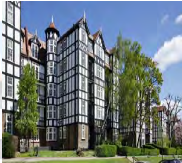
Holy Lodge Regeneration

Somos éticos y nos sentimos orgullosos de nuestra integridad. Operamos con los estándares más altos de conducta profesional y ética a nivel mundial, con cero tolerancia hacia cualquier forma de corrupción. En este contexto, requerimos que nuestros sub-contratistas y proveedores demuestren credenciales profesionales, comerciales y ambientales igualmente sólidas. La Ley de Soborno 2010 - recientemente adoptada en el Reino Unido - sustenta tanto los altos estándares que ya aplicamos en nuestra empresa, como nuestros valores interdisciplinarios.