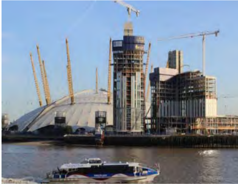
O2 Intercontinental Hotel

Somos un equipo de profesionales que trabaja estrechamente, gestionando todos los aspectos de la vida de una propiedad, desde la concepción hasta el producto terminado, y aún más allá en la gestión de instalaciones, perfeccionando el diseño, la arquitectura, la planificación, la ingeniería, la construcción, la administración de proyectos, la resolución de conflictos y la sustentabilidad.