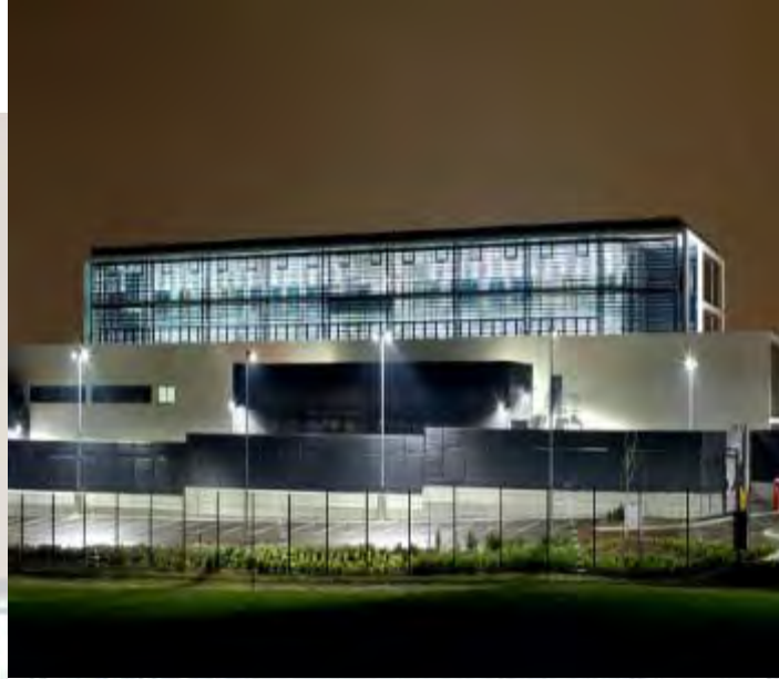
North Kent Police

Se inicia con estudios de costos y factibilidad de diseño, estudios financieros, ambientales y de diligencia debida de diseño, adquisiciones y consideraciones de planificación, consulta con los inversores, autoridades de planificación y gobiernos, incluyendo ingeniería general o especializada, profesionales de la construcción y equipos jurídicos, entre otros.