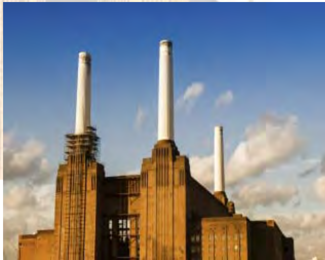
Battersea Power Station

Nosotros lo llamamos modelo interdisciplinario. Hemos adoptado y adaptado el enfoque interdisciplinario, logrando lo que muchos en nuestra profesión aspiran: puede definirse como la eficacia perfecta y detallada. Básicamente, es la diferencia entre cómo funciona un agregado de personas y como funciona un equipo.