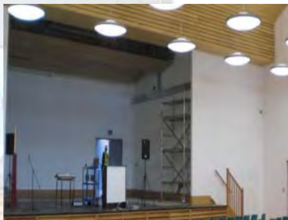
St. Mark's Academy

Creemos que el trabajo debe ser interesante y fomentamos el equilibrio saludable entre trabajo y vida personal tanto en nuestro equipo como en nuestros socios, reconociendo la importancia de la responsabilidad colectiva.