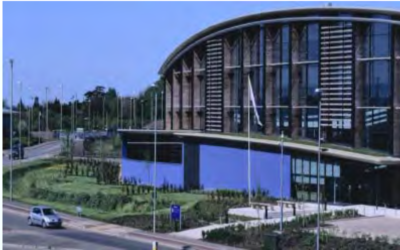
Gloucestershire Constabulary HQ

Hemos obtenido las certificaciones de calidad ISO 9001 y 14001 y contamos con un estricto conjunto de principios de sustentabilidad bajo los cuales somos auditados externamente.