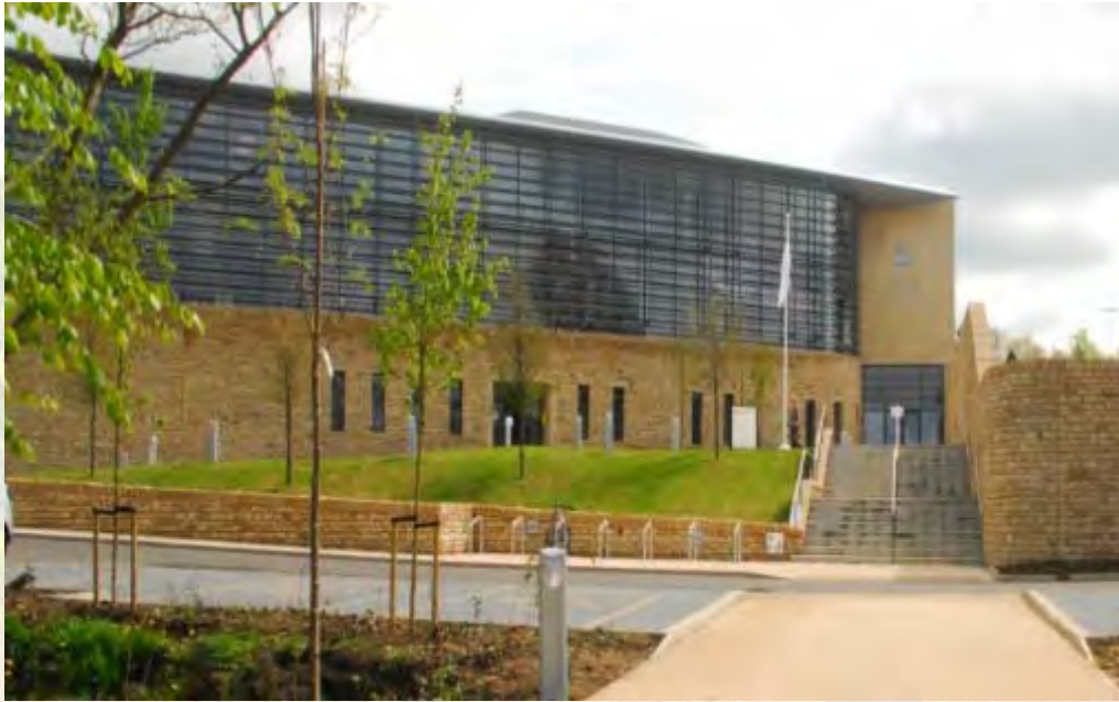
Harrogate Police Station

Por eso, cuando empezamos a colaborar con nuestros clientes, la primera impresión es que nuestro personal es inteligente y puntual. Nuestros espacios de trabajo son prolijos y nos diferenciamos por las pequeñas cosas, tales como mantener nuestros teléfonos en silencio y no tomar llamadas durante reuniones. En otras palabras, somos verdaderos profesionales.