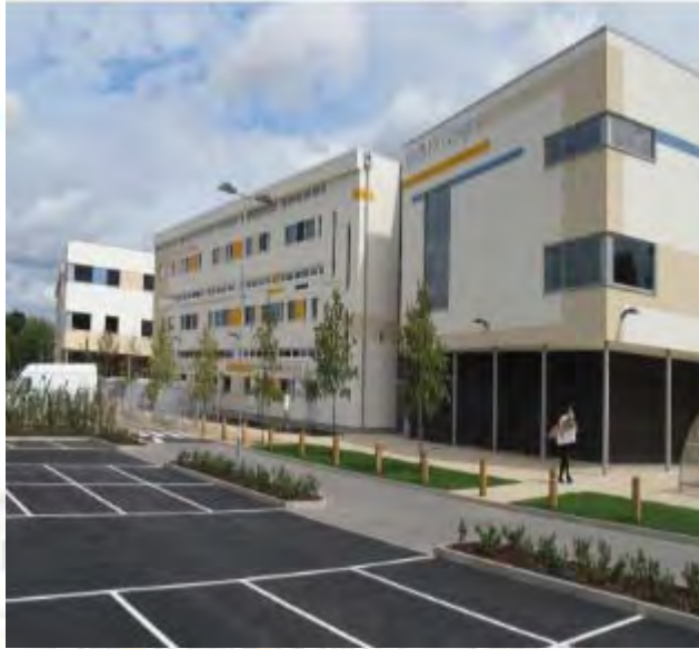
Garth Hill College

Lo anterior refleja el ADN de nuestra cultura y enfoque. Nos centramos en las necesidades del cliente y los requisitos del proyecto, proporcionando un marco para la interacción con clientes y colegas. El “WoW” sirve de orientación para todos los miembros del equipo, estableciendo los altos estándares de excelencia que nos han colocado en una posición líder en el campo profesional.