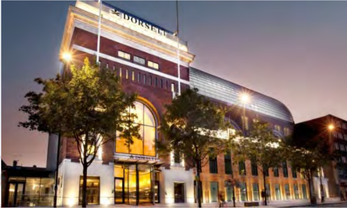
Dorsett Shepherd's Bush Hotel

Nuestra extensa red de contactos profesionales incluye contadores y equipos de abogados globales así como también empresas constructoras de renombre internacional. Nuestras relaciones van desde acuerdos formales tales como joint ventures, atrayendo nuevos socios o inversores a colaboraciones informales consolidadas por la experiencia y trayectoria de trabajo conjunto.