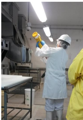
Ilustración 3 Colaboradora con su EPP

En lo referente al cumplimiento de la ley 185, todos nuestros colaboradores (as) tienen contrato formal con la compañía ya sea este por tiempo determinado, indeterminado o por servicios profesionales.