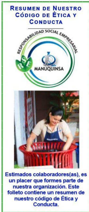
Ilustración 13 Brochure Resumen del CEC

La Primera fue la divulgación al personal en las oficinas de Manuquinsa donde participaron todos los colaboradores (as) que ejercen sus labores en la oficina central como, Presidencia, Gerencia General, Informática, Recursos Humanos, Ventas, Compras, Operaciones, Mantenimiento, Contabilidad y Almacén.