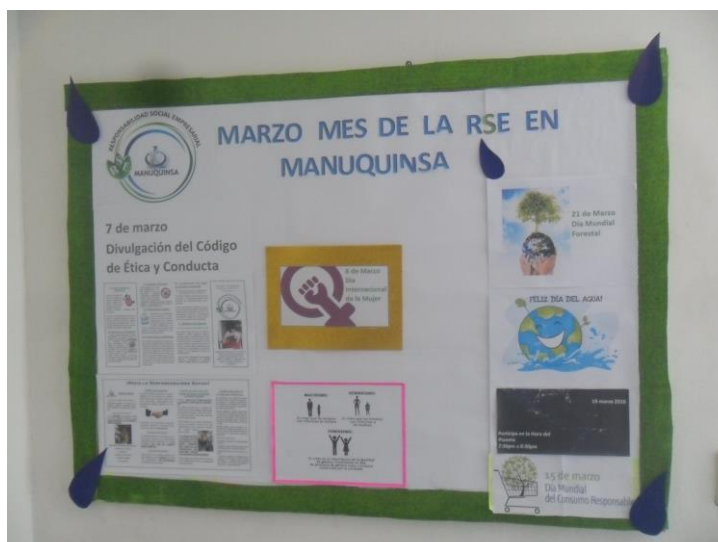
Ilustración 7 Mural del Mes de Marzo "Mes de la RSE en Manuquinsa"

La unidad de Calidad-RSE retoma el uso de un mural informativo donde ese presentan las efemérides del mes, se plasman temas del Sistema de Gestión de Calidad, entre otras.