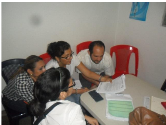
Ilustración 12 Nuestra Responsable de Recursos Humanos leyendo el CEC

En la sección 3.2.1.4 Soborno y corrupción, de Nuestro Código de Ética y Conducta establece que no se podrá realizar de forma directa o indirecta, ningún pago monetario u otra clase de beneficio a cualquier persona física o jurídica con la intención de: abusar de su influencia real o aparente, para obtener ilícitamente cualquier tipo de beneficio u ocultar un pago o gasto para beneficio de los involucrados.