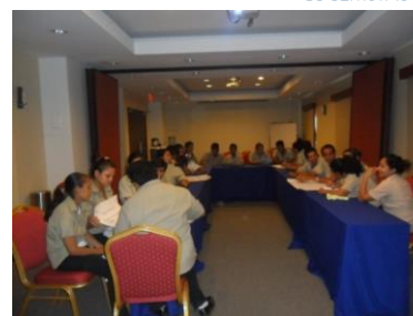
Tabla 8 Capacitaciones II Semestre 2015

El departamento de Recursos Humanos mediante la Unidad de Capacitaciones, en el segundo semestre del 2015 capacito a un total de 169 colaboradores (as) en los siguientes temas: