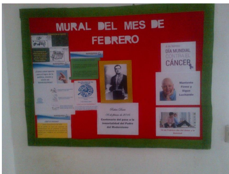
Ilustración 8 Mural de Mes de Febrero

También se da comunicación vía correo electrónico donde, se envían mensajes referentes a la temática RSE así como acciones que se pueden tomar para minimizar los impactos ambientales individuales al medio ambiente.