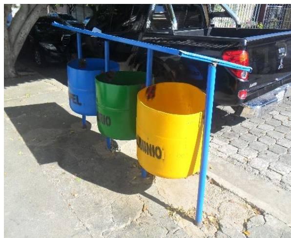
Ilustración 9 Cestos de Desechos según su tipo

Para aportar a la disminución de los impactos ambientales en septiembre de 2015 Manuquinsa colocó cestos de basura en las afueras de sus instalaciones en las Oficinas Centrales con el objetivo de evitar que nuestros colaboradores (as) echaran los desechos en las calles, mismos que pueden ser utilizados por la comunidad aledaña a la empresa con el mismo fin.