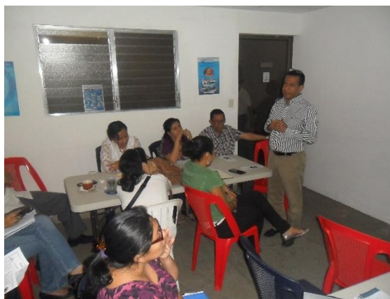
Ilustración 11 Gerente General exponiendo el CEC

La Divulgación del Código se llevó a cabo según el Plan de Divulgación del Código de Ética y Conducta 2016, con la finalidad de comunicar a nuestros colaboradores (as) la visión de la empresa hacia la responsabilidad social con su CEC, el cual se desarrolló en cuatro fases.