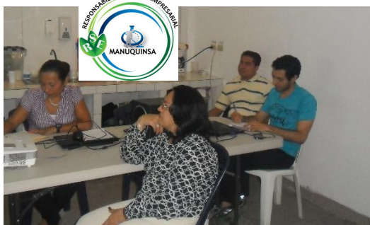
Ilustración 4 Capacitación Charla Virtual

La alta Gerencia impulsa una educación continua a sus colaboradores(as) mediante la Unidad de Capacitaciones y la Unidad de Calidad-RSE en diversos temas.