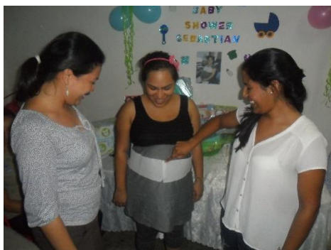
Ilustración 2 Celebración de Baby Shower

Así mismo celebramos el baby shower de nuestras colaboradoras (es) donde todos y todas aportamos algo para llevar a cabo el evento.