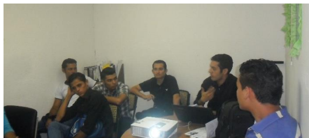
Ilustración 5 Inducción en temas de RSE

La Unidad de Calidad-RSE promueve la participación en capacitaciones virtuales brindadas por ICONTEC. Los asistentes están en dependencia de la temática que se abordará el día de la capacitación.