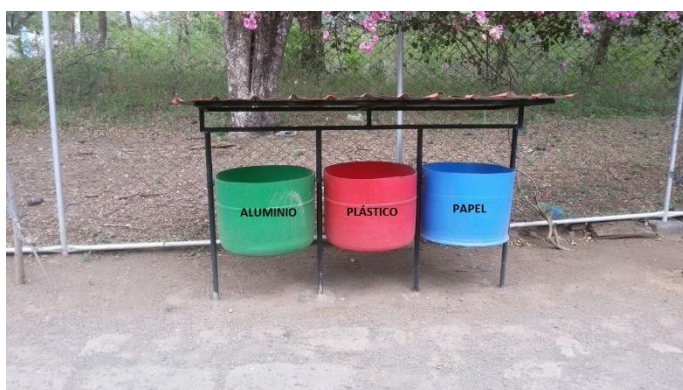
Ilustración 10 Cestos de desechos en Bodega Km12

Del mismo modo colocó cestos de desechos en la bodega del Km 12 carretera Vieja a León, con el mismo objetivo de evitar la proliferación de desechos en las calles.