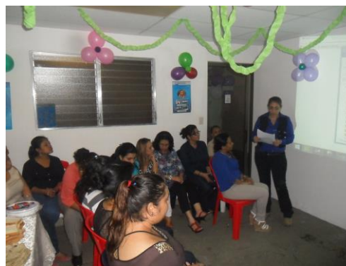
Ilustración 1 Celebración día de la Mujer

El 8 de marzo de 2016 hemos celebrado el día internacional de la mujer organizado por la Unidad de Calidad-RSE en conjunto con sus colaboradores(as) donde se recitaron poemas y proverbios dedicados a la mujer, palabras de los integrantes de la Unidad de Calidad-RSE y luego un almuerzo con un pastel.