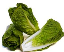
LECHUGA MINI ROMANA