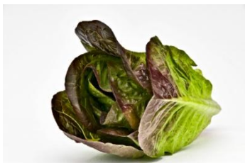
LITTLE GEM ROJA