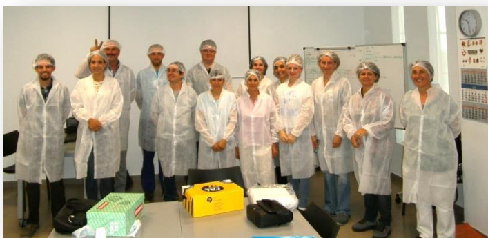
Visita a instalaciones de cliente

Semanalmente se realizan reuniones en la que se abordan cuestiones de índole principalmente productivas pero también dudas y sugerencias de cualquier índole surgidas durante la semana.