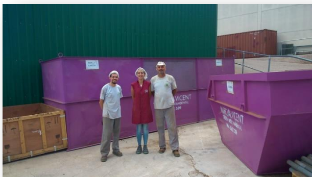
Zona Ambiental en FRUSEMA

En la batería de indicadores presentada al final de informe se pueden ver algunos de los resultados obtenidos.