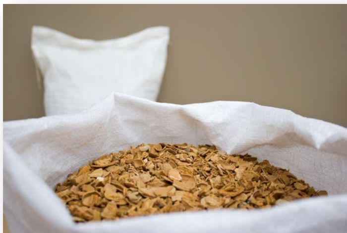
Cáscara de almendra utilizada como biocombustible

Se realiza seguimiento al consumo de cáscara de almendra. La tendencia experimentada en estos últimos años va en aumento. Entre los principales motivos se baraja el bajo coste que este biocombustible tiene frente a otros como el gasóleo o la electricidad.