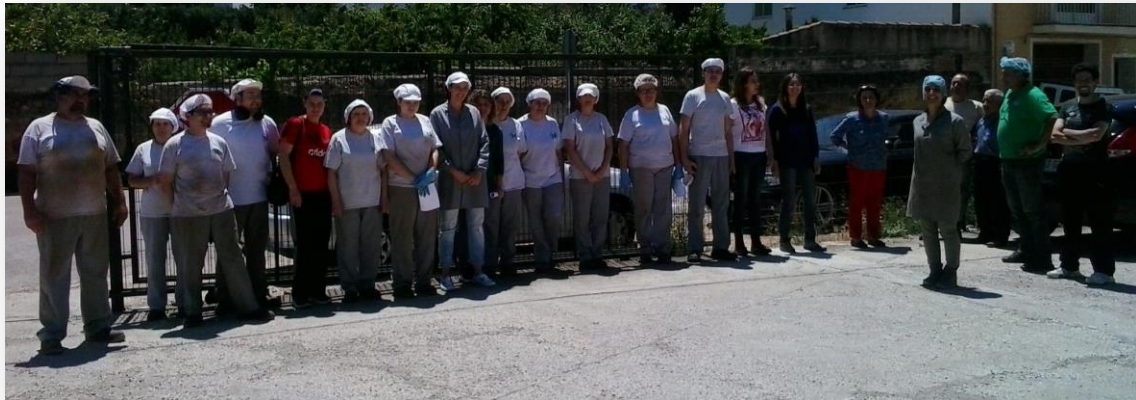
Simulacro de incendio 2015