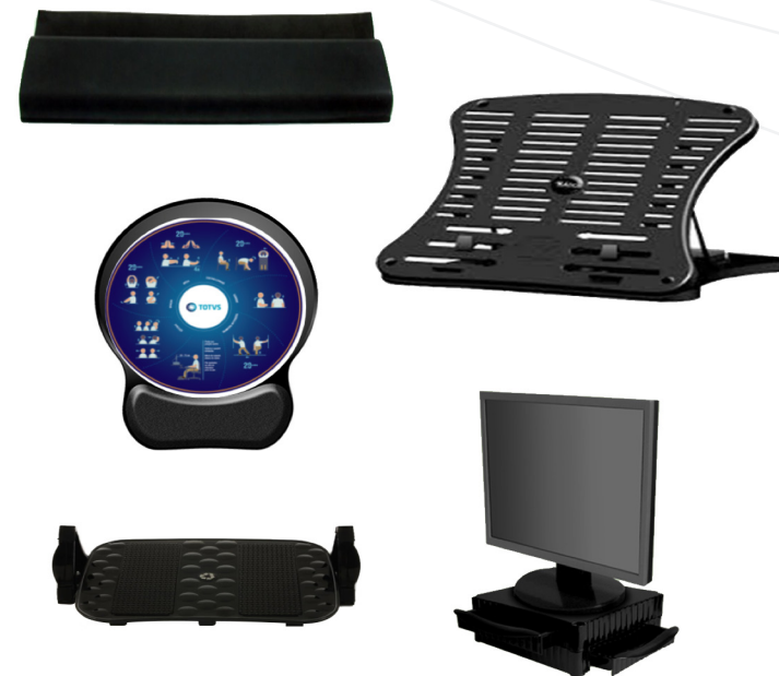
Apoio de punho para teclado, suporte para notebook , mouse pad , apoio para os pés, suporte de mesa para o monitor

Todos os produtos adquiridos ( mouse pad , apoio para os punhos, suporte de monitor, suporte para notebook e apoio para os pés),