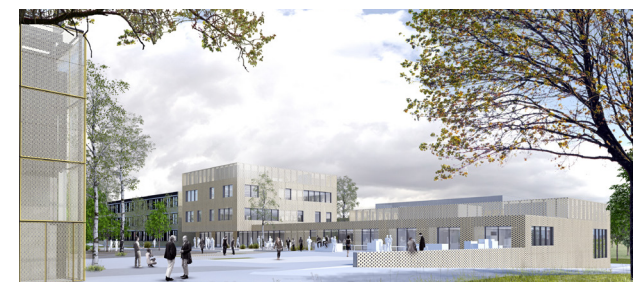
I 2015 vandt vi konkurrencen om at designe to nye undervisningsbygninger til DTU-BYG / In 2015 we won the competition to design two new education buildings at DTU-BYG.