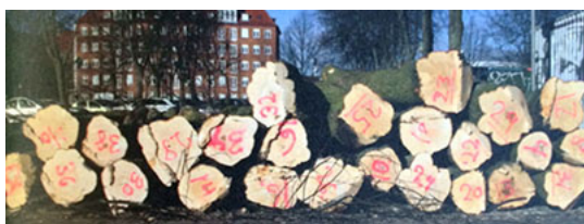
Vi havde rejsegilde på Niels Bohr Bygningen som skal stå færdig i 2017 og indeholder 55.000 m 2 undervisning. Bygningen vil genbruge de træer som vi måtte fælde for at gøre plads på Campus, de får nyt liv som borde og stole i huset / Topping-out at Niels Bohr Building for The University of Copenhagen. A new 55.000 m 2 modern education building, which will be ready in 2017. The project re-use the trees that we had to remove in order to gain enough space, the fallen trees will be up-cycled in the shape of tables and chairs.