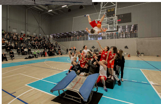
Til åbning på Gentofte Sportshal fase 3 / The inauguration of new sports hall at the Gentofte Sports complex