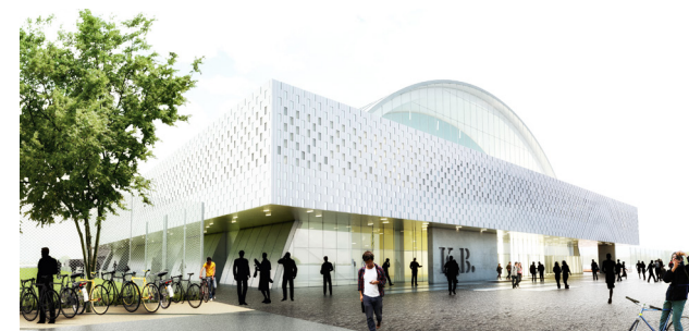
2015 vandt vi konkurrencen om at designe den ny K.B. Hallen som brændte ned i 2011 / In 2015 we won the competition to re-design K.B. Hall, after the iconic building burned to the ground in 2011.