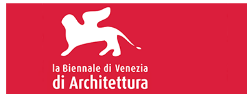
Vi er repræsenteret ved nogle af vores bæredygtige projekter i tre pavilloner på arkitektbiennalen i Venedig 2016 / Some of our sustainable projects will be on display at this year's architectural biennial in Venice, we will be part of three pavilions.