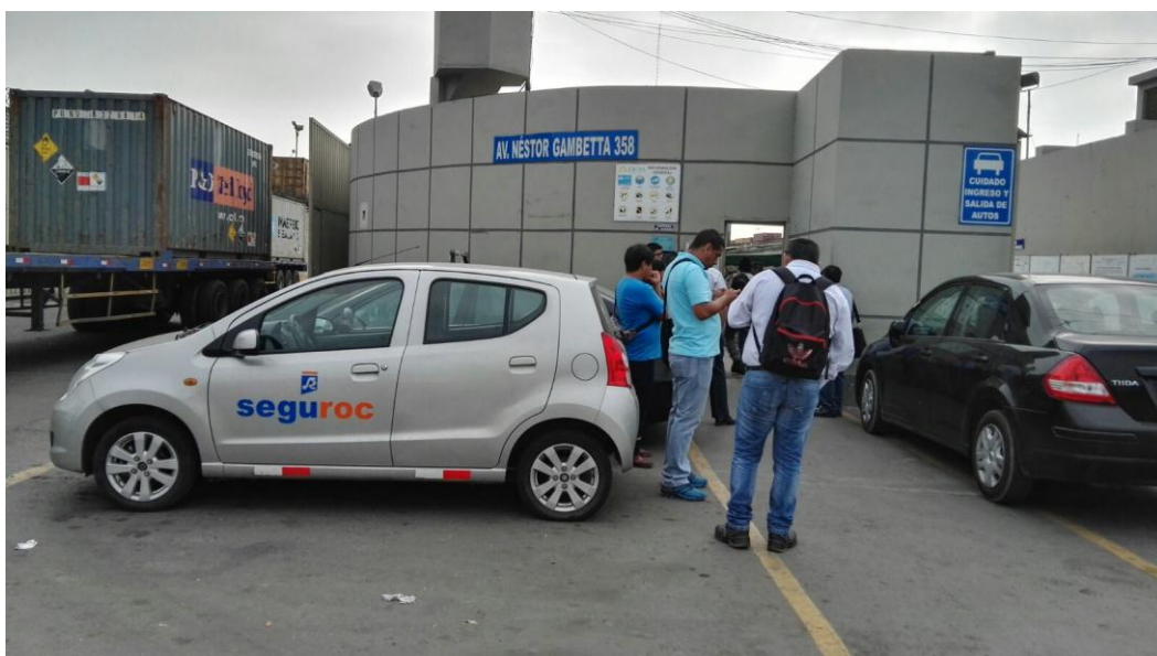
Prevención de sobornos