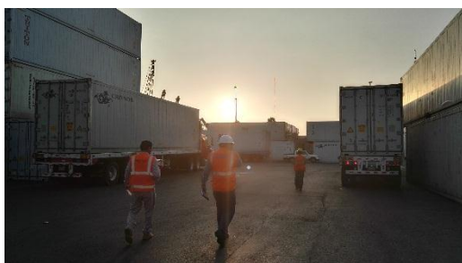
Inspecciones in situ de las operaciones