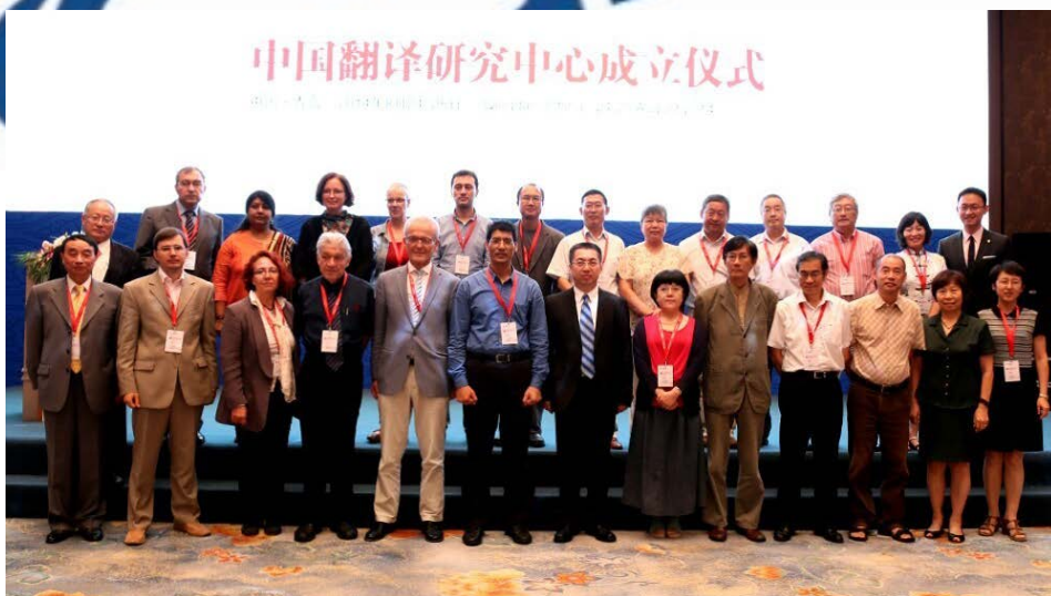
由中国出版集团整合国内外翻译资源倾力打造的“中国翻译研究中心”在海滨之都青岛正式揭牌成立。

四十余年来，经过几代中译人的共同努力，中译公司人员规模从最初的 18 人发展到现有的 100 余人，机构设置由 1 个翻译部发展到 6 个翻译部；拥有学有所长、经验丰富的专业翻译团队，20 多人享受国务院政府特殊津贴，40 多人被授予“资深翻译家”称号，是中国翻译界的一面旗帜；中译专家顾问团队囊括了会议口译界的资深专家、翻译专业资格考试委员会专家、翻译界的资深翻译家、国家部委资深翻译专家，以及各大高校翻译专业知名专家、学者、教授等；中译签约译员团队数百人，遍布全球各地。作为联合国翻译服务提供商（1973 年至今）、全国翻译专业资格水平考试授权培训机构，中译公司优秀的团队以及丰富的资源成为高品质翻译培训的有力保障。2014 年，承办首届中国文化国际传播恳谈会取得圆满成功，建立了“中国翻译研究中心”。