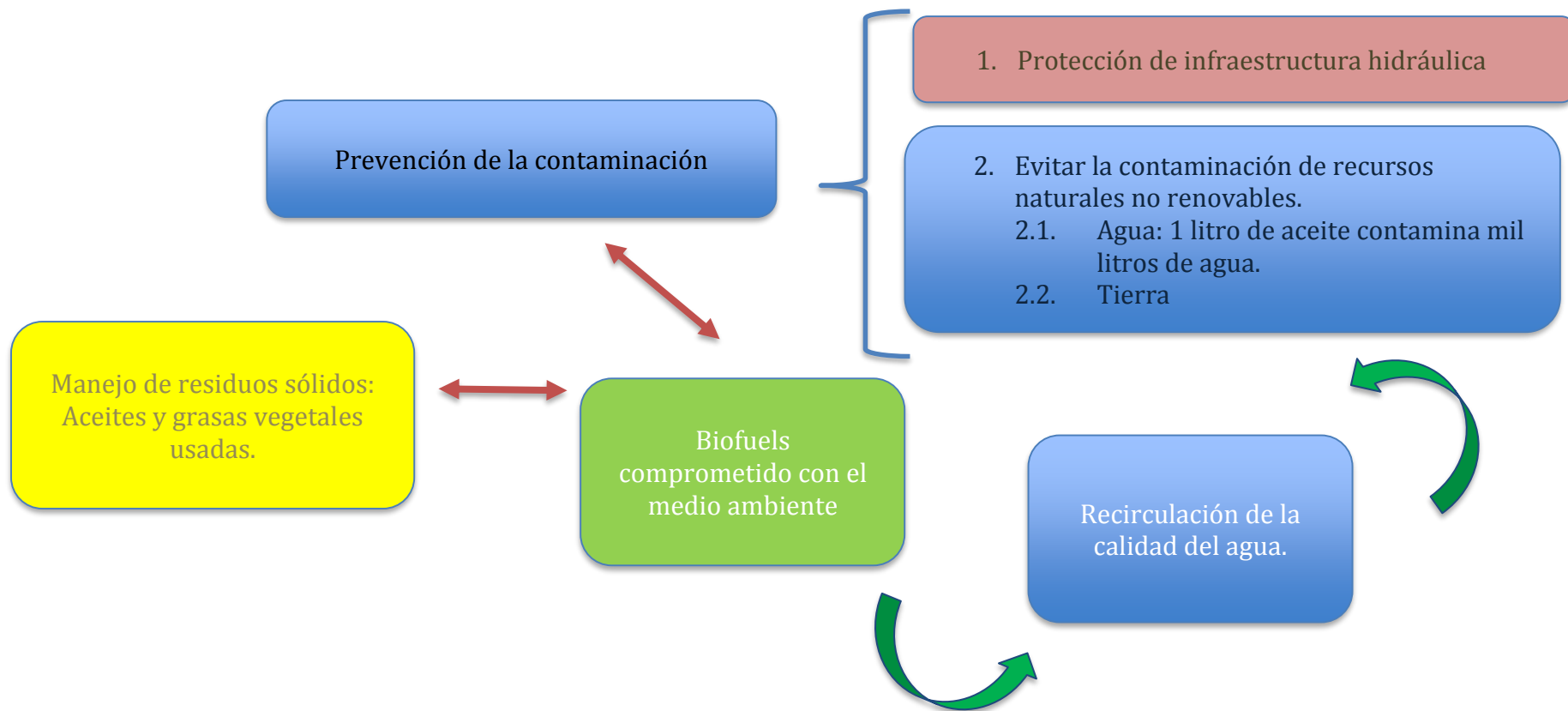
Esquema 2. Impacto ambiental Biofuels de México en la recolección de aceite vegetal usado