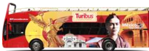
El Turibus de la Ciudad de México utiliza Biodiesel C4, biodiesel producido por Biofuels de México, S.A. de C.V.

ACCIONES: Producción y suministro de Biodiesel C4. Se han realizado investigaciones sobre los usos del biodiesel en el transporte y en la industria en general siendo notables los descubrimientos.