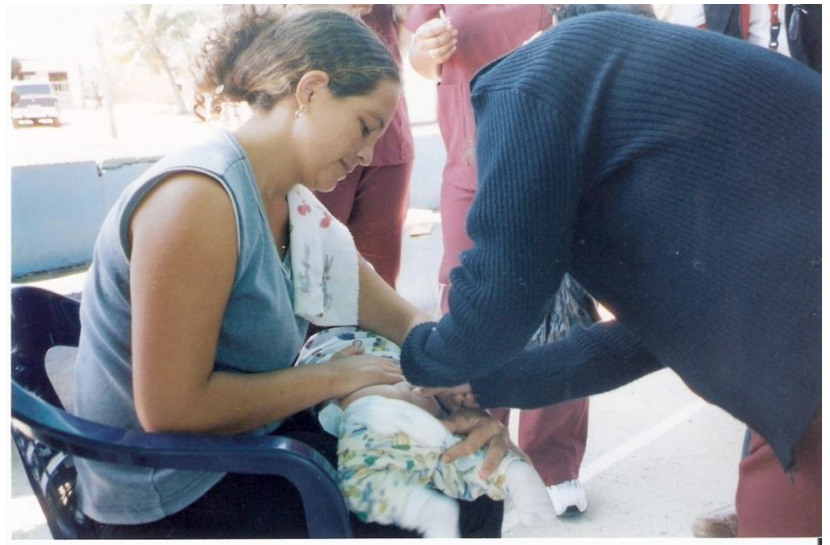
Jornada de vacunación a niños y adultos.