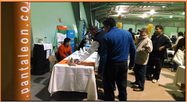
Participación en feria del empleo

Actualmente 12 de los 22 alumnos que iniciaron pasantías ya forman parte de la plantilla de colaboradores ocupando las plazas vacantes.