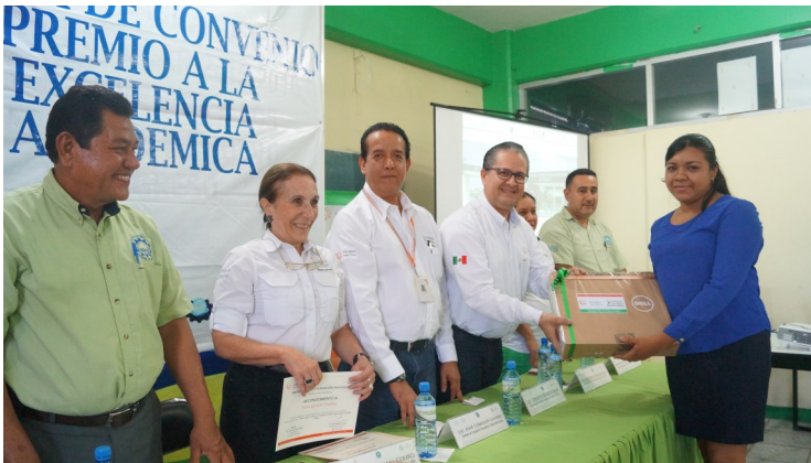
Premio a la Excelencia Académica