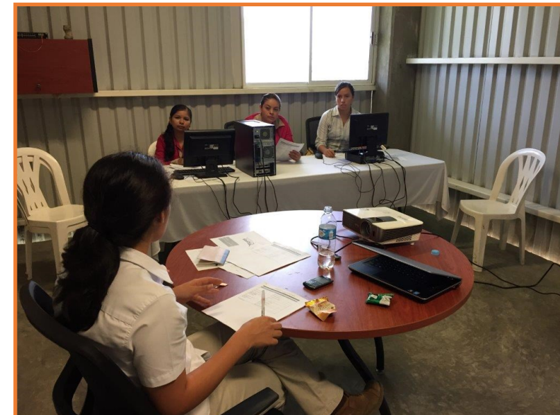
Capacitación para censo PILARES

Actualmente se realiza el plan de acción para atender las necesidades principales apoyados del área de Desarrollo Social, Recursos Humanos y Fundación Pantaleon quienes gestionarán las alianzas pertinentes para desarrollar los proyectos que beneficiarán a nuestros colaboradores.