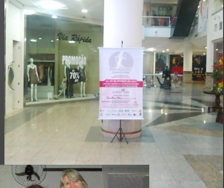
Banner em uso no piso