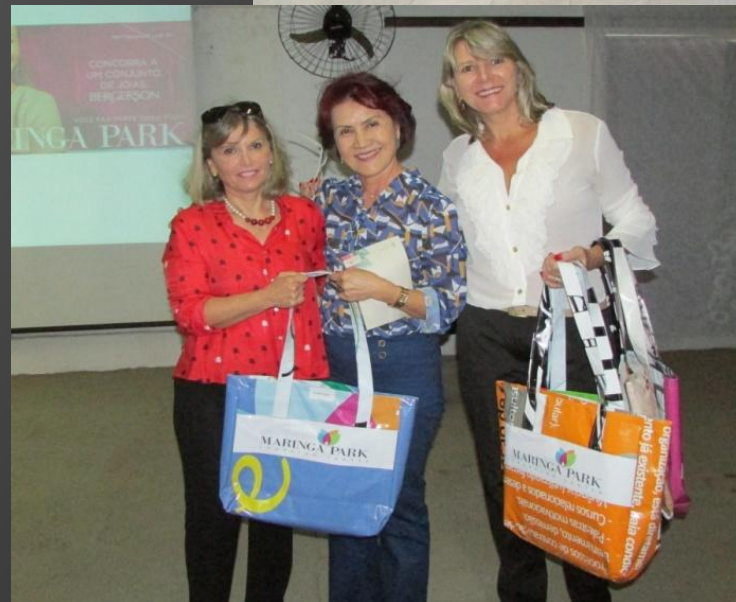
Após a reciclagem