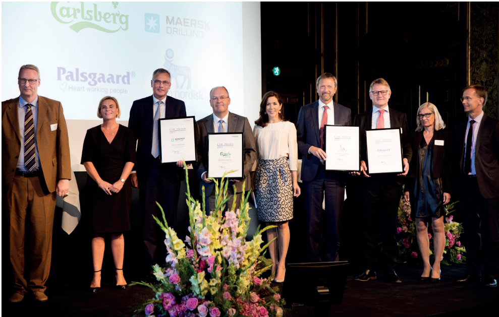
På CSR-konferencen overrakte Kronprinsesse Mary CSR Prisen 2015 til de 4 vindervirksomheder.

I september 2015 satte konferencen fokus på, hvordan bæredygtighed kan være drivkraft for forretningsudvikling. Det gjorde vi med afsæt i FNs Sustainable Development Goals og med velkomsttale fra FNs formand Mogens Lykketoft samt oplæg fra førende virksomheder inden for bæredygtighed og fra FNs Global Compact. Konferencen trak fulde huse med 350 deltagere fra virksomheder, organisationer, NGO'er, offentlige instanser og akademien, og var med til at sætte FNs nye bæredygtighedsmål på agendaen i Danmark.