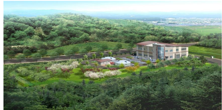
- 원주기업도시 폐수종말처리시설