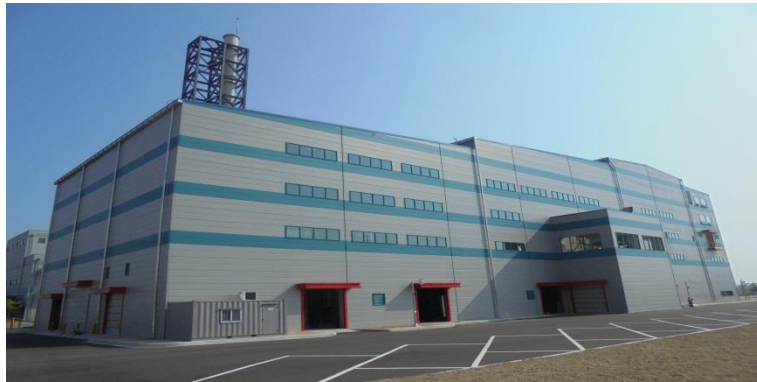
- 개성공단 폐기물 처리시설