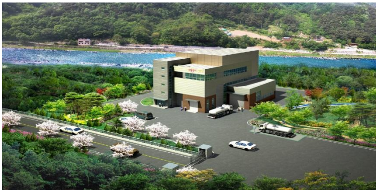
- 정선군 분뇨처리시설