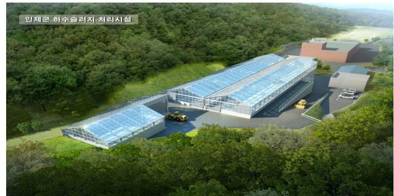
- 인제군 하수슬러지 처리시설

※ 친환경공법 사용하여 기타 건설공사 시공 진행 (재활용 자재 사용, 태양광 패널 사용, 지열공사 활용 등)