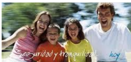
Ampliación de Beneficios de Seguro de Gastos Médicos Mayores