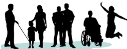
Inclusión Social Laboral