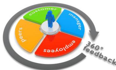
Fortalecer Nuestras Competencias