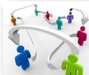
Fortalecer la Comunicación Interna