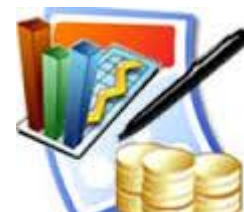
Evaluamos Sueldos y Beneficios