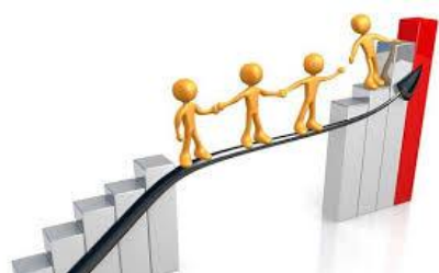
Mantener a los Colaboradores Motivados