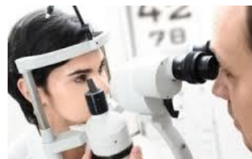
Campaña de Salud Visual