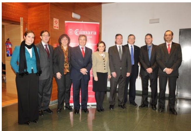
Jornada “La Responsabilidad Social en la cadena de suministro empresarial: una cuestión de negocio”. Cámara de Comercio de Madrid, marzo 2011