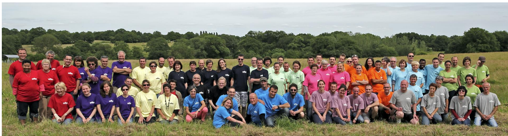
L'équipe des Côteaux Nantais aux 70 ans de l'entreprise

Agir pour les Droits de l'Homme, le respect des normes du travail, la préservation de l'environnement et contre la corruption nous apparaît être un devoir en tant qu'entreprise engagée et citoyenne.