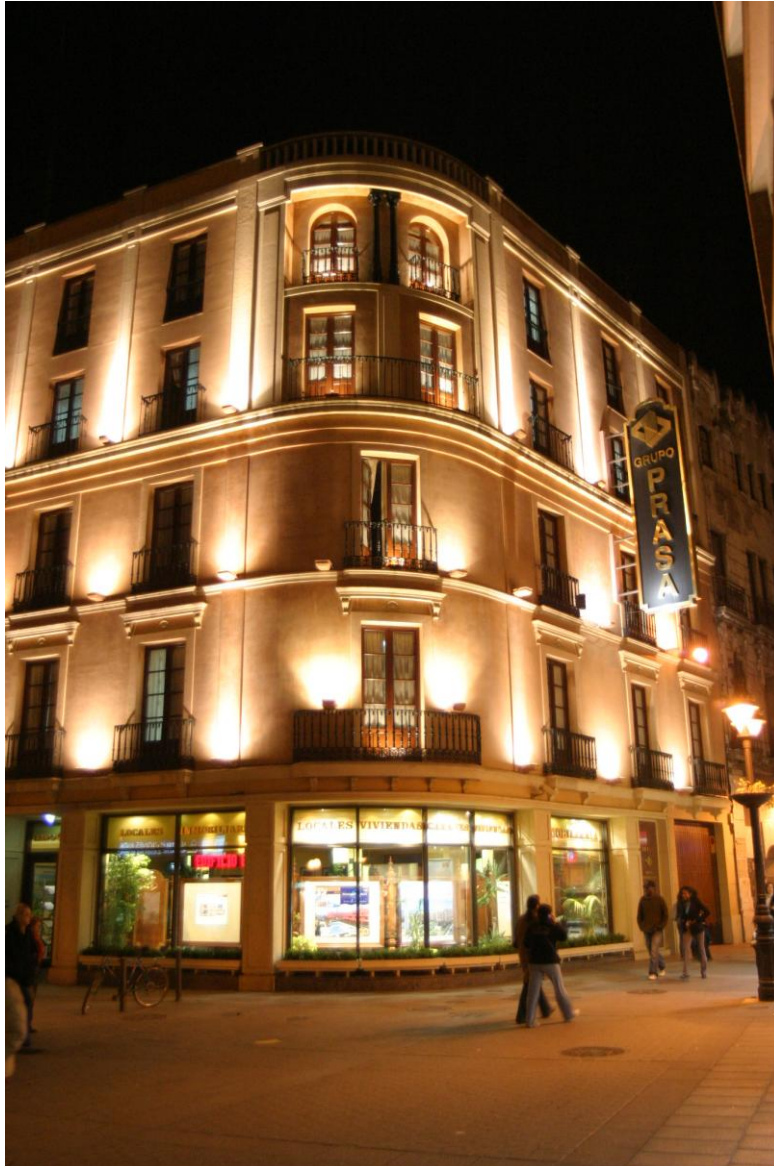
Grupo Prasa Av. Gran Capitán, 2, 3º planta. CÓRDOBA Córdoba