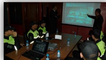
Programa de formación inicial y continúa

Hemos desarrollado diversas vías de comunicación y de supervisión cuya implantación fue definida como un instrumento para asegurar el buen funcionamiento de nuestros servicios así como las buenas condiciones laborales de nuestro personal, evitando posibles vulneraciones de derechos y/o actividades no deseadas.