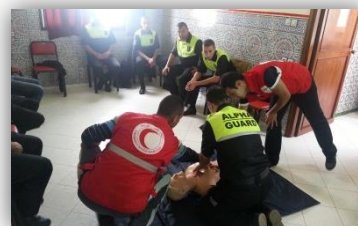
Formación en socorrismo y primeros auxilios

Dentro del sector en el que desempeñamos nuestra actividad, nuestra empresa resalta por apostar siempre por una serie de formaciones iniciales y otras continuas, enfocadas a nuestro personal, consiguiendo así que estén provistos de las herramientas necesarias, ya sean cognitivas como materiales, para el buen desarrollo de su actividad laboral en condiciones dignas y eficientes.