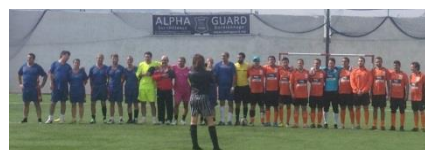
ALPHA GUARD HA SIDO PATROCINADOR OFICIAL DEL "I ENCUESTRO FUTBOL 7" DE INSTITUCIONES ESPAÑOLAS TANGER-TETUAN

Dentro de nuestra política de responsabilidad medioambiental y para hacer más eficaz y visible nuestra aportación en este campo, desde Alpha Guard hemos patrocinado y apoyado activamente diferentes actividades deportivas, culturales, sociales, etc.; dedicadas a la concienciación colectiva y relacionadas con políticas medioambientales.