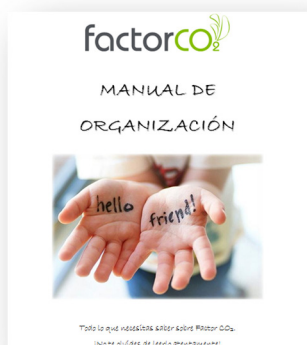
Ilustración 1: Portada del Manual de Organización elaborado por Factor CO 2

de actuación, prevención de riesgos laborales, anexos explicativos en torno a las herramientas de trabajo, etc.