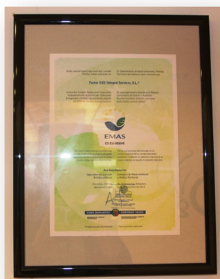
Ilustración 3: Certificado de inscripción en el Registro Comunitario de Gestión y Auditoría Medioambientales (EMAS)

Estas iniciativas voluntarias se han mantenido durante 2014, ya que durante este periodo se ha procedido a realizar todos los cálculos e informes correspondientes para conservar y renovar las certificaciones comentadas. Asimismo, se ha informado a los grupos de interés sobre dichas acciones, con el objetivo de comunicar las buenas prácticas de la organización y aumentar la concienciación en torno a los aspectos medioambientales en el ámbito empresarial y el respeto por el entorno en general.