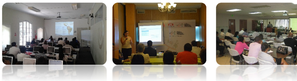
Ilustración 4: Imágenes de jornadas de capacitación en las que ha participado Factor CO 2 durante 2014

De la misma forma, en dicho año la organización también ha mantenido sus alianzas y colaboraciones con entidades diversas de carácter no lucrativo, como la ONG Copade y FSC, promotores de la campaña Madera Justa, de la que Factor CO 2 es socia. Se trata de una iniciativa cuyo objetivo consiste en sensibilizar a la ciudadanía sobre el consumo responsable de productos derivados forestales, como la madera o el papel. Así, se promueve la compra de artículos respetuosos con el entorno, como aquellos que cuentan con el sello FSC, productos de Comercio Justo o productos con la doble garantía FSC + Comercio Justo. En relación con ello, es destacable que Factor CO 1 continúa siendo, desde el año 2012, Patrono fundacional de la Fundación CMAE, entidad dedicada a mejorar la calidad ambiental mediante el control de la contaminación, el uso sostenible de los recursos, la disminución de los impactos del cambio climático, la eficiencia energética o la promoción de las energías renovables, entre otras cuestiones.