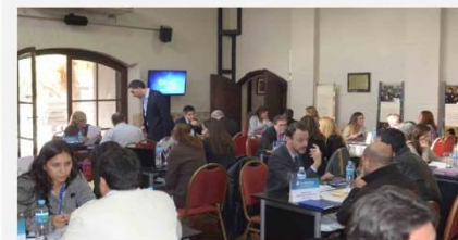
RONDA DE NEGOCIOS