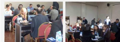
RONDA DE NEGOCIOS