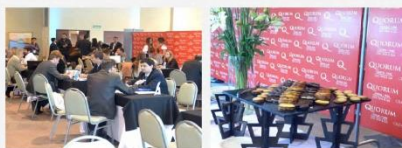
RONDA DE NEGOCIOS