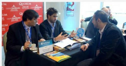
RONDA DE NEGOCIOS