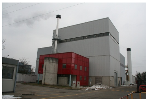
Chaudière biomasse des Papeteries du Léman