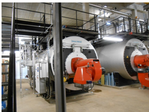
Chaudière biomasse des Papeteries des Vosges

Cette nouvelle chaudière est alimentée par 20.000 tonnes/an de bois brut et de palettes broyés, de déchets de scieries et d'écorces, issus exclusivement de la filière locale. Le recours à cette énergie locale et renouvelable permettra ainsi d'éviter l'émission de 8.000 tonnes de CO 2 par an.