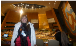
CSW Comisión Estatus de la Mujer