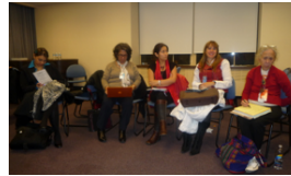
Caucase América Latina