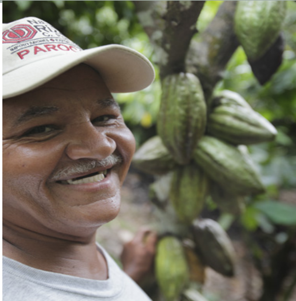
Nazario Rizek SAS. Comunicación de Progreso (COP). 2014 /2015.