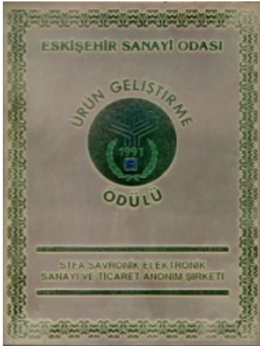
ESO Ürün Geliştirme Ödülü