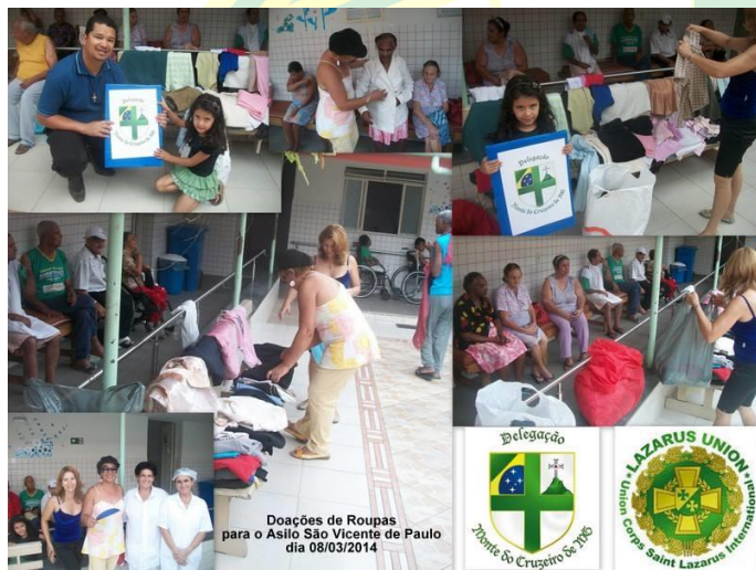
Doações de Roupas para o Asilo São Vicente de Paulo dia 08/03/2014

A Delegação Monte do Cruzeiro de Minas Gerais estará promovendo novas ações sociais nos próximos meses com o apoio da ACLA/MG de Manhuaçu.