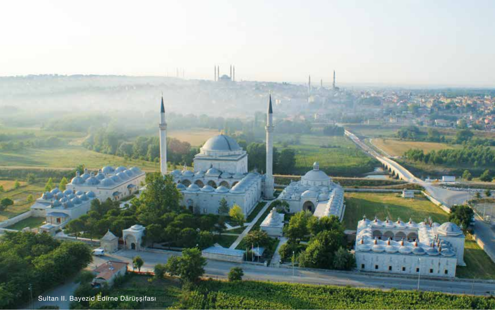
Sultan II. Bayezid Edirne Dârüşşifası