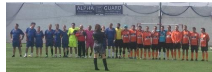
ALPHA GUARD HA SIDO PATROCINADOR OFICIAL DEL "I ENCUESTRO FUTBOL 7" DE INSTITUCIONES ESPAÑOLAS TANGER-TETUAN

Dentro de nuestra política de responsabilidad medioambiental y para hacer más eficaz y visible nuestra aportación en este campo, desde Alpha Guard hemos patrocinado y apoyado activamente diferentes actividades deportivas, culturales, sociales, etc.; dedicadas a la concienciación colectiva y relacionadas con políticas medioambientales.