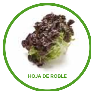
HOJA DE ROBLE