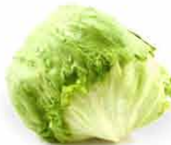
Lechuga iceberg 20.000.000 uds.