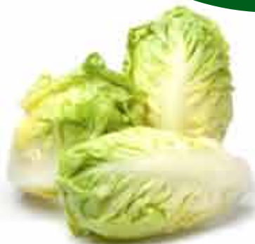
Cogollos y corazones de cogollo little Gem 40.000.000 uds.