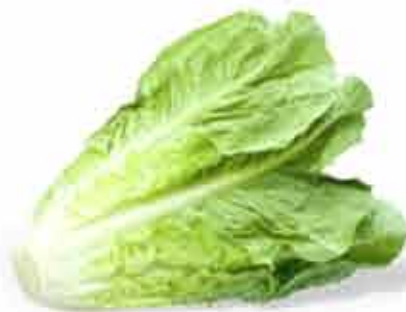
Lechuga romana 40.000.000 uds.