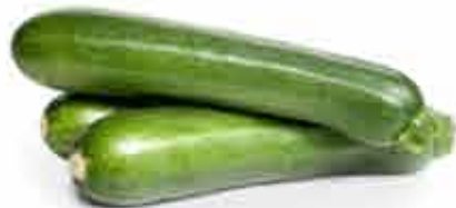
Calabacín verde 15.500.000 Kg Uno de los principales productores de España