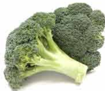
Brócoli 5.275.000 Kg