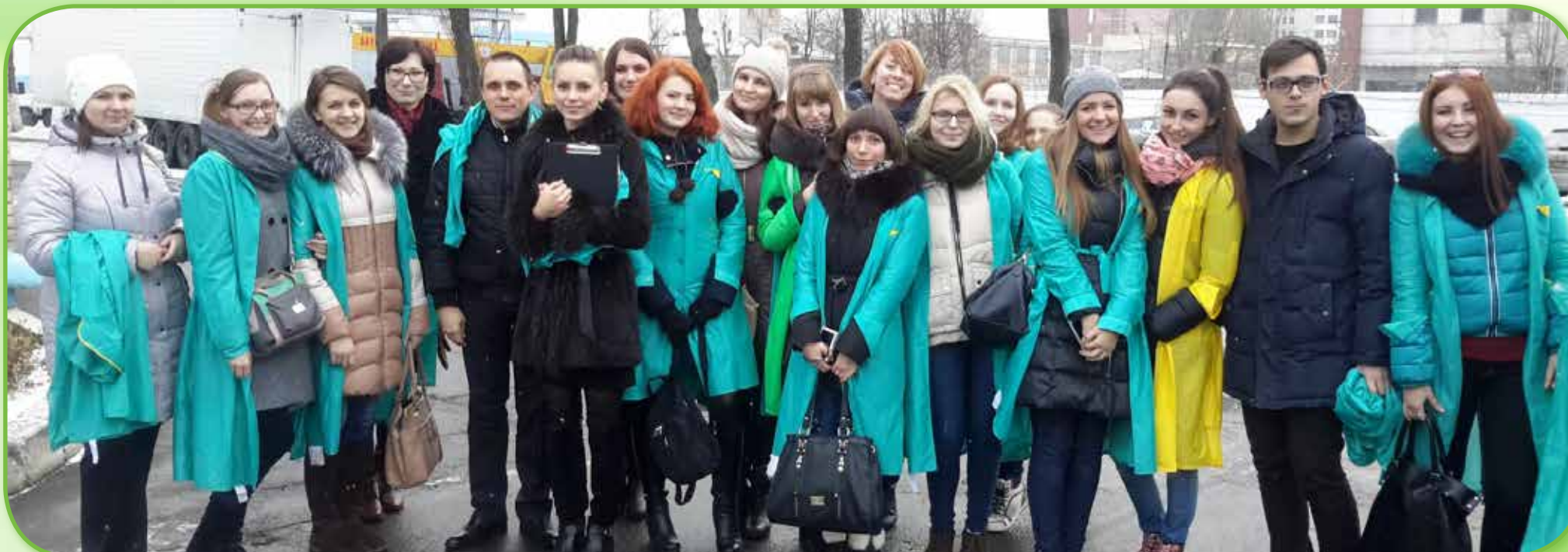
Студенты и преподаватели «Белорусского государственного экономического университета»

За 2014 год предприятие посетило свыше 700 человек. Особое внимание уделяется визитам школьников старших классов. Для них посещение действующего производства – это в том числе возможность профориентации. Стоит заметить возрастающий интерес к посещению предприятия со стороны студентов белорусских вузов.