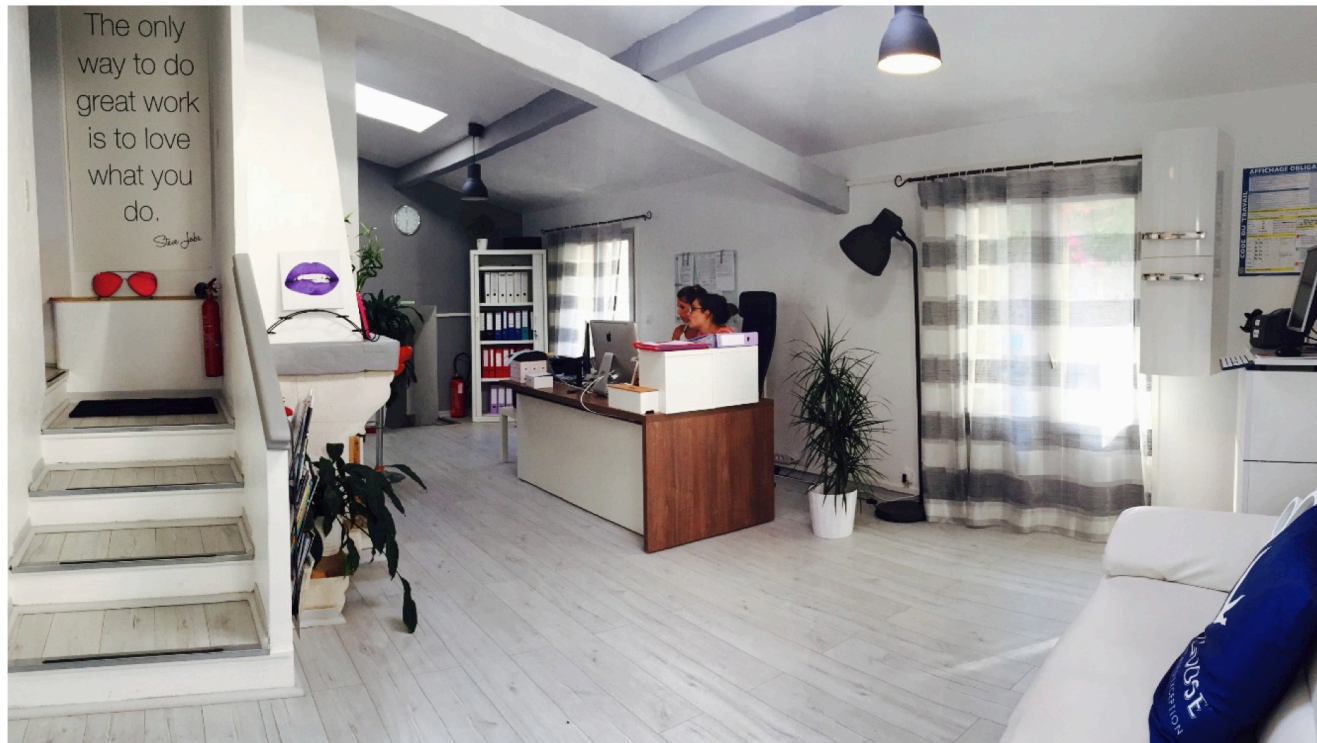
La Smart Villa