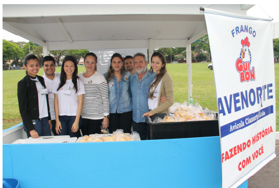
Ação Social - Justiça no bairro