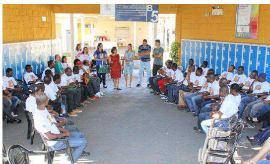
Conclusão do curso de Idioma e Cultura Brasileira para estrangeiros