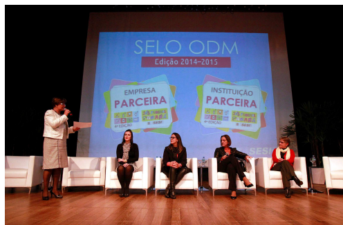
ODM - Apresentação da Avenorte na entrega do selo ODM