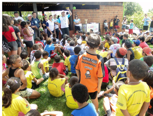
Atleta do futuro