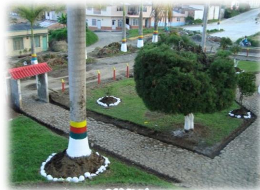
Mantenimiento de parques y zonas verdes, cabecera Municipal Quinchía Risaralda