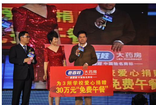
图 6 “老百姓”爱心捐赠 30 万元“免费午餐”

陕西回归研究会儿童村是全国第一家专为在押犯遗留的未成年子女提供免费代养代教服务的民间慈善机构，其经费大多来自国际慈善机构及社会捐助。老百姓大药房陕西公司自 2005 年起，就一直对该机构进行爱心援助。2011 年 10 月 27 日，老百姓大药房全国管理机构的员工自发组织，筹集了 15765 元的爱心善款捐赠给陕西回归研究会儿童村，为孩子们提供生活和学业上的帮助。