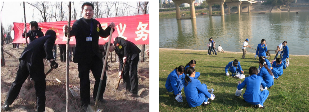
图 1 植树造林、城市环卫，老百姓大药房积极履行对生态环境的职责

保护生态环境，促进人与自然的和谐相处，老百姓大药房一直积极参与。如陕西公司开展的“拯救森林·筷行动”，免费向消费者赠送携带方便、健康环保的不锈钢筷子，号召消费者抵制一次性筷子；湖南公司免费向消费者赠送树苗，号召大家一起绿化环境，优化自然生态；天津公司组织为天津河北区北宁动物园捐款，呼吁广大市民爱惜动物，对生态环境予以关注等。老百姓大药房希望通过自己的行动，号召更多的人履行对生态环境的职责，为子孙后代创造良好的生存环境。