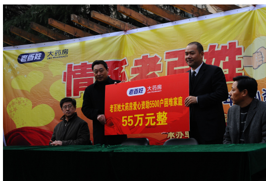
图 12 爱心资助 5500 户困难家庭捐赠现场

2009 年 4 月，流感快速传播，老百姓大药房立即在全国发起预防甲流系列活动——制作了 40 万份抗流感宣传页在全国门店免费派送，并为顾客免费派发中药凉茶、口罩、板蓝根等，制作了抗流感海报在门店及社区宣传栏进行张贴，提醒市民养成“勤洗手、多通风、少扎堆”的良好习惯，有效预防甲流传播。