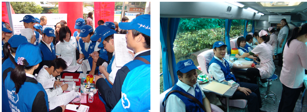
图 15 “老百姓”员工积极报名捐献造血干细胞

众一道加入了造血干细胞捐献者行列,很多员工更是在采集血样后现场献血。“老百姓爱心汇”成立后,每年将组织全国 600 多家门店开展 6000 多场爱心活动,并积极宣传造血干细胞捐赠活动。