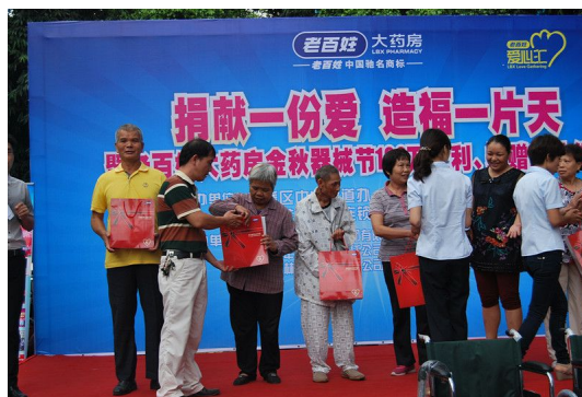
图 17 广西公司向福利敬老院捐赠爱心器械