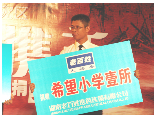
图 4 老百姓大药房捐赠希望小学一所