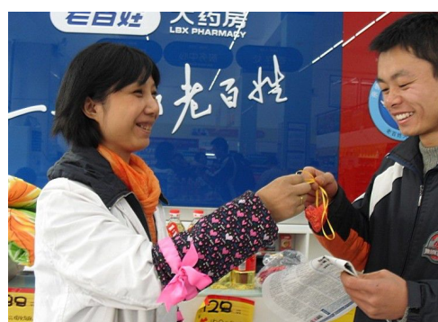
图 14 门店药师为公交司机送上防流感香囊

2009 年 10 月 27 日，老百姓大药房在湖南长沙发起成立了“老百姓爱心汇”公益组织，成为我国第一个自发进行造血干细胞知识宣传的药品零售企业。当天活动现场，由“老百姓爱心汇”发起的“义卖大比拼”和“造血干细胞志愿捐献”活动同期进行，老百姓大药房董事长谢子龙和公司其他 50 多名志愿者与现场群