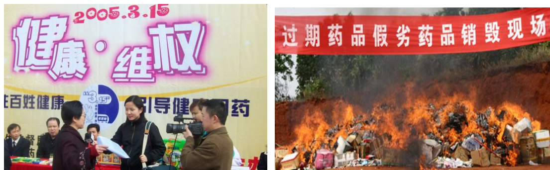
图 2 过期药品回收及销毁大行动

能环保知识和安全合理用药常识。例如，各省公司每年都开展的“过期药品回收”活动，为防止过期药品重新流入社会危害群众健康或因随意丢弃而污染环境，老百姓大药房每年都会投入大量资金，制作海报在门店和社区宣传栏进行张贴，号召市民合理购药以免浪费，并对过期药品进行回收，并根据药品价格水平兑换相应的礼品或现金券。公司每年都会回收上十吨的过期药品并联合各地政府监督部门一起进行销毁，每年投入到过期药兑换新药或现金券活动的费用就达 200 余万元。