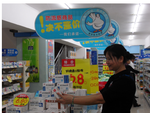
图 13 流感期间，抗流感药品绝不涨价

2009 年 11 月，老百姓大药房整合全国 14 个省市资源，开展了向的士及公交车免费赠送 200 万个中药香囊的大型公益活动，以此来预防流感在人口流动比较频繁的的士或公交车上进行传播。