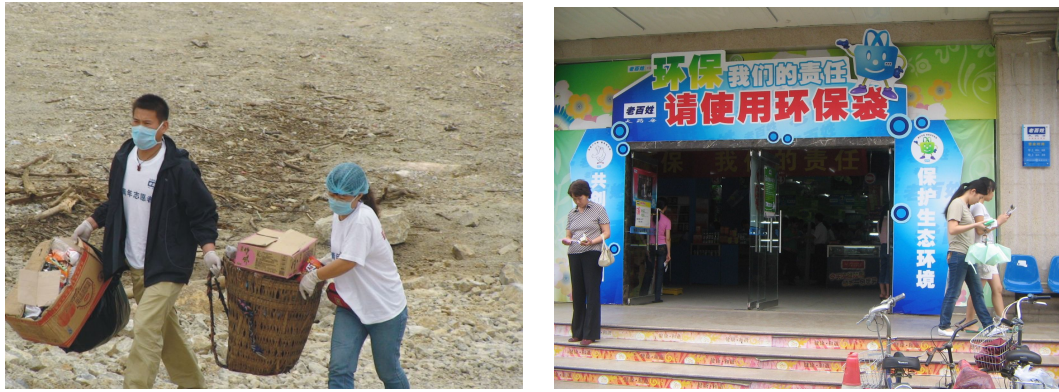
图3 宣传环保理念促进市民加强环保