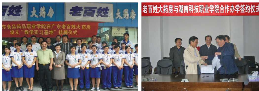
图 10 老百姓大药房与多所学校合作成立教学实训基地，共同合作办学，吸纳学生实习就业

2011 年 1 月 11 日，共青团湖南省委邀请了部分在湘的全国人大代表、全国政协委员、省人大代表、省政协委员以及新生代农民工代表共 50 余人，在老百姓大药房会议厅开展面对面沟通交流活动，探讨并了解新生代农民工的诉求，热议新生代农民工融入社会的问题。