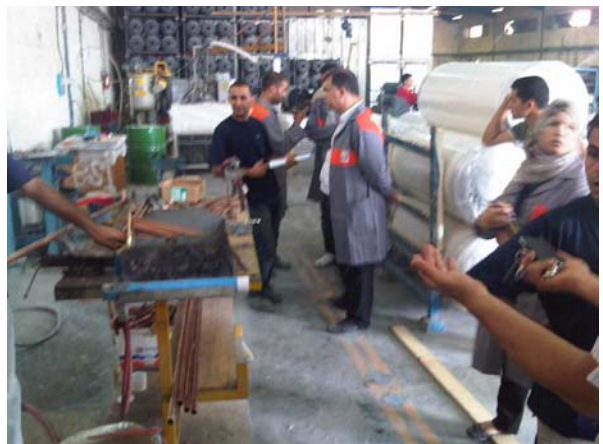
Figure N°01: Formation du personnel de BSI