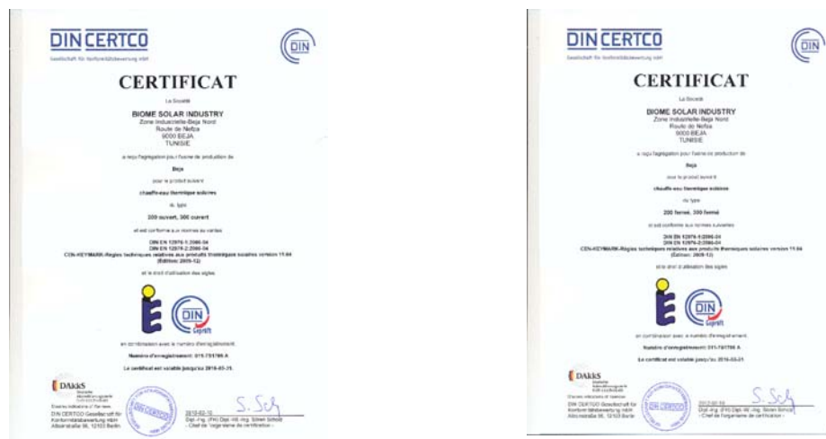
Figure N°03: Certificat Solar Key Mark