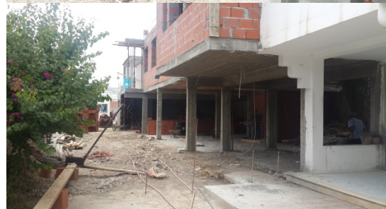
Figure N°06: Avancement des travaux de construction du Centre de formation BSI