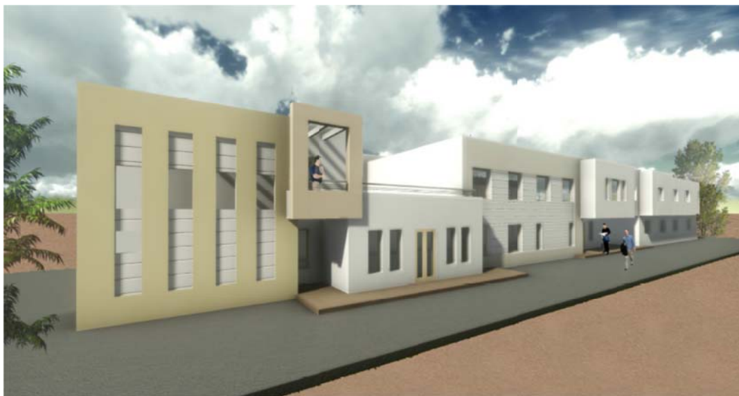
Figure N°05: Centre de formation BSI

En 2014, les travaux de construction continuent de progresser en ce qui concerne environ 80% de la surface concernée, alors que les 20% restants sont achevés le 5 mars 2015 (réfectoire et vestiaire). Les 80% de la surface comprennent la partie allant du rez de chaussée et le premier étage jusqu'à l'ancien bâtiment seront achevés dans les délais (date initiale d'achèvement prévue dans le contrat)