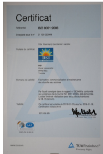
Figure N°02: Certificat ISO 9001