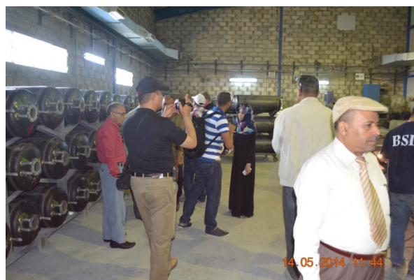
Figure N°04: Visite de BSI par des parties prenantes locales et étrangères