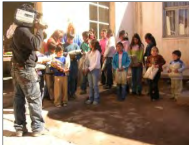
Alumnos de la escuelita recibiendo zapatillas y guardapolvos para el inicio de clases.