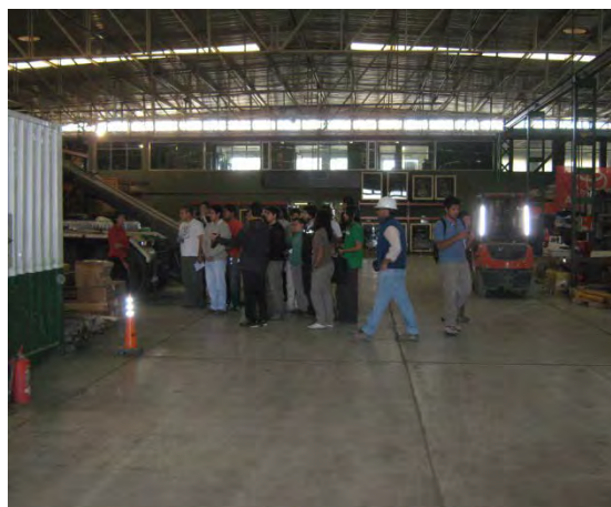
Los alumnos durante la visita guiada al almacén y Taller de Eco Minera S.A.