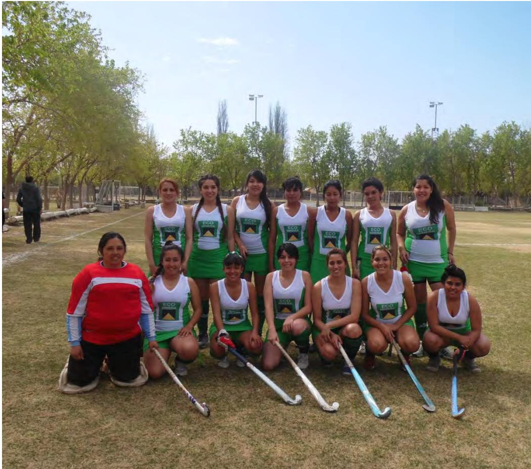
Integrantes del equipo de hockey luciendo los uniformes donados por Eco Minera S.A.

En Agosto del 2014 sponsoreamos al equipo de hockey femenino del Club Recreo Deportivo de Rawson de la provincia de San Juan.