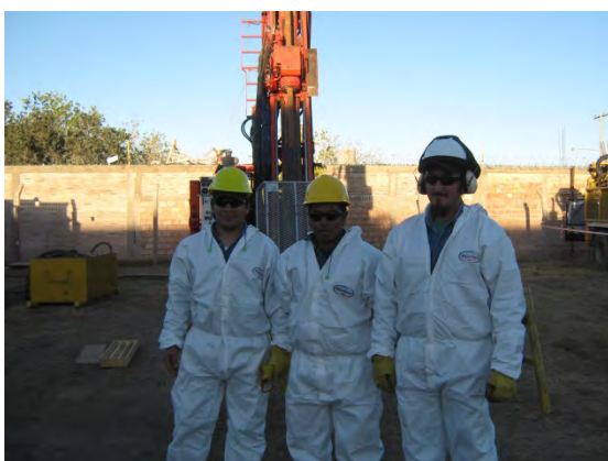
Perforistas y Ayudantes de Eco Minera S.A. durante la demostración práctica a los alumnos.