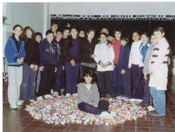
Alumnos de la Escuela Manuel Belgrano

En forma conjunta, decidimos participar del Programa de Reciclado de Papel llevado a cabo por la Fundación Garrahan. El objetivo del mismo era introducir en la comunidad, la práctica habitual de separar, juntar y donar el papel en desuso y al mismo tiempo: