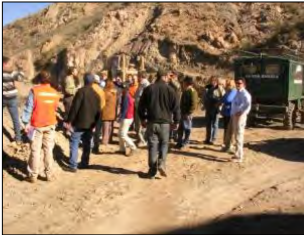
Gerente Comercial y Jefe de Logística de Eco Minera S.A. con el personal de la Escuela Provincia de Entre Ríos.

En el año 2009 realizamos un camino alternativo desde Villa Mercedes hasta la Escuela Provincia de Entre Ríos, ubicada en las inmediaciones del proyecto Gualcamayo, en el Departamento de Jáchal, Provincia de San Juan. Nuestro objetivo era evitar que los niños dejaran de concurrir a clases debido a los intensos problemas de lluvias y el mal estado del acceso principal.