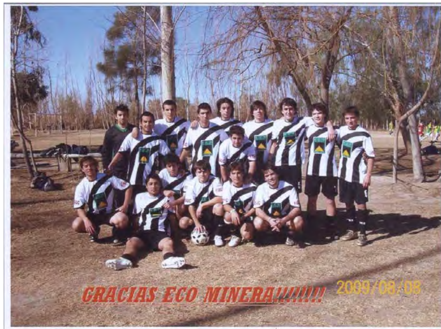
Integrantes del equipo de fútbol luciendo los uniformes sponsoreados por Eco Minera S.A.

Durante el año 2008 sponsoreamos al equipo de fútbol de la Facultad de Ingeniería de la Universidad Nacional de San Juan.