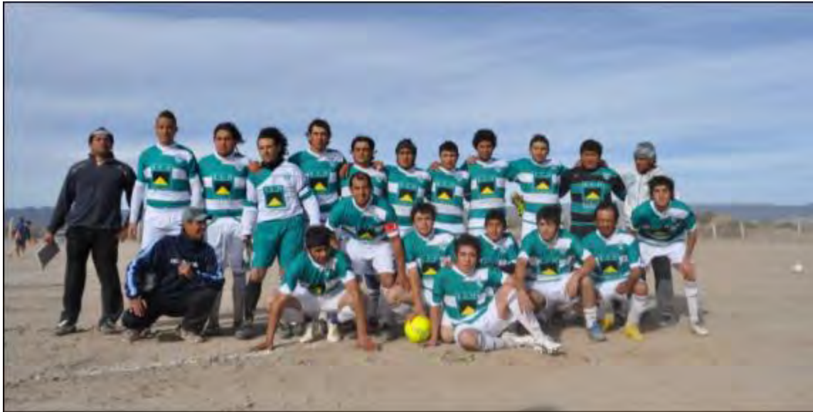
Integrantes del equipo de fútbol luciendo los uniformes sponsoreados por Eco Minera S.A.

Durante el año 2012, en forma conjunta con la Municipalidad de Iglesia de la Provincia de San Juan, sponsoreamos a un equipo de futbol de primera división de la comunidad.