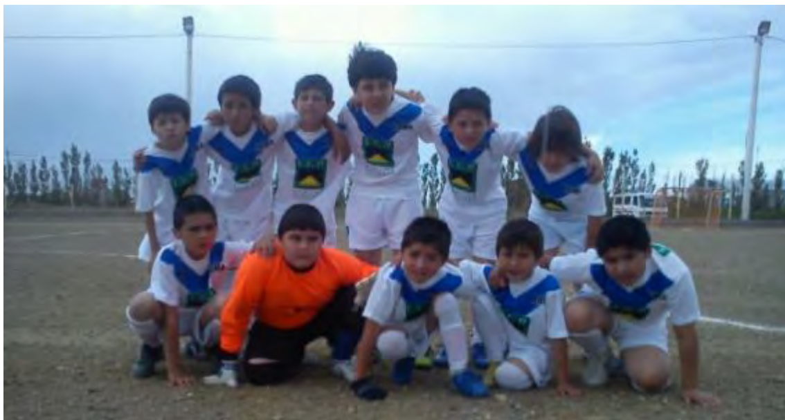
Integrantes del equipo de fútbol de infantil luciendo los uniformes donados por Eco Minera S.A.

En Noviembre del 2012 donamos el equipamiento para un equipo de fútbol infantil de la comunidad de Puerto San Julián de la Provincia de Santa Cruz.