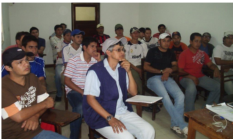
Charla Técnica NTN