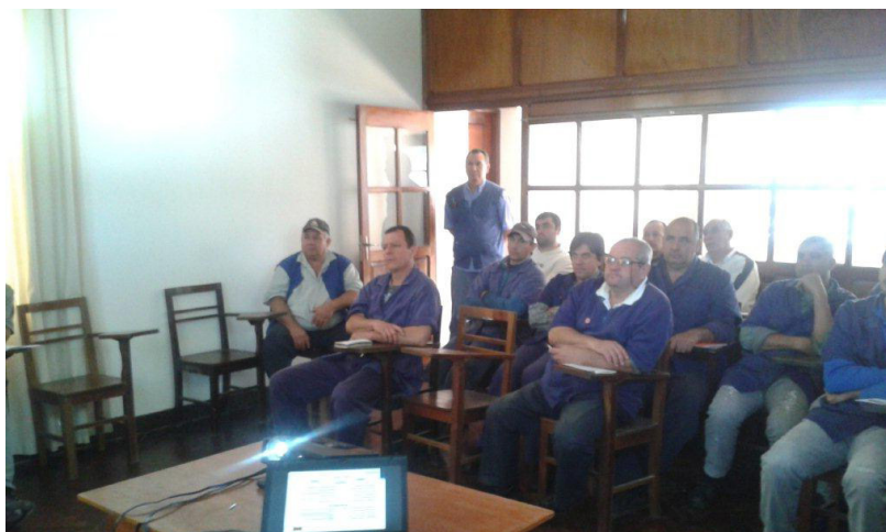
Charla de Seguridad de Higiene Industrial