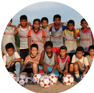
Promoción de la recreación infantil