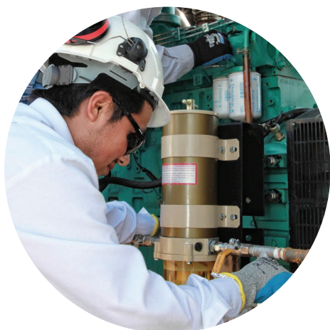
Controles estrictos de calidad.