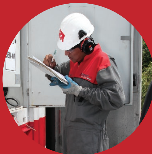
Inspección de rutina