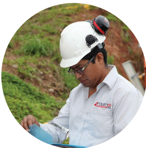
Políticas basadas en Derechos Humanos