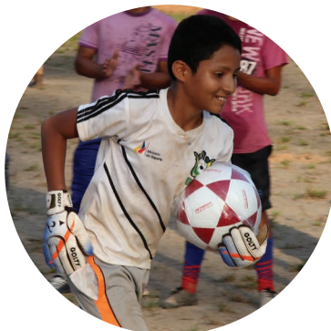
Derecho al juego