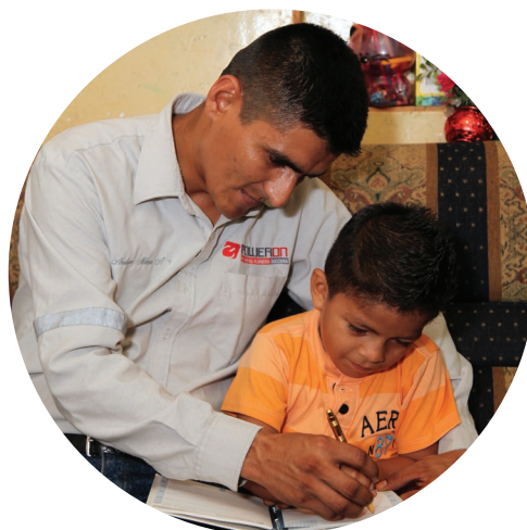
Trabajo en responsabilidad social corporativa