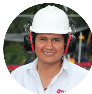
Personal altamente capacitado