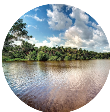
Cuidado del medio ambiente