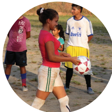
Equidad entre niños y niñas