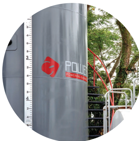
Tanque de abastecimiento de combustible