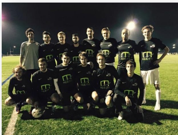
Bureau des sports de l'ENSEIRB

→ MERITIS a financé les maillots de toute l'équipe de foot