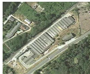
Hijos de Luis Chao Sobrino, S.A.