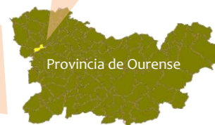
Provincia de Ourense