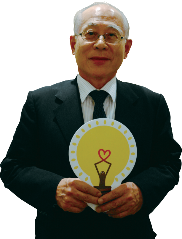
환경재단 이사장 이세중

환경재단은 앞으로 각계 각층과의 활발한 협력과 연대를 통해 모든 생명이 지속 가능한 미래를 이루고자 노력할 것입니다. 이러한 노력을 여러분께서 지켜봐 주시기 바랍니다.