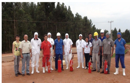
Treinamento da Cipa