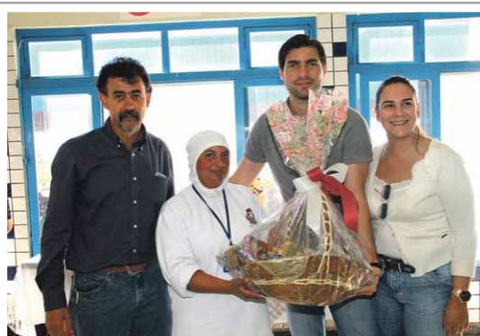
Dia das mães