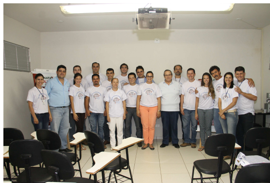
Campanha Natal Solidário