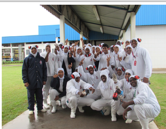
Contratação de estrangeiros