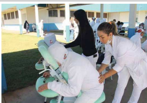
Dia da mulher