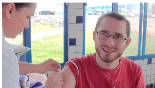
Aplicação de vacinas