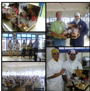
Dia dos pais