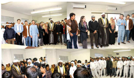
Inauguração da Mesquita