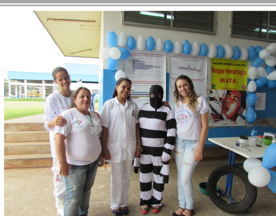
Campanha da dengue