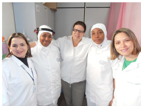
Campanha contra câncer de colo de útero e de mama