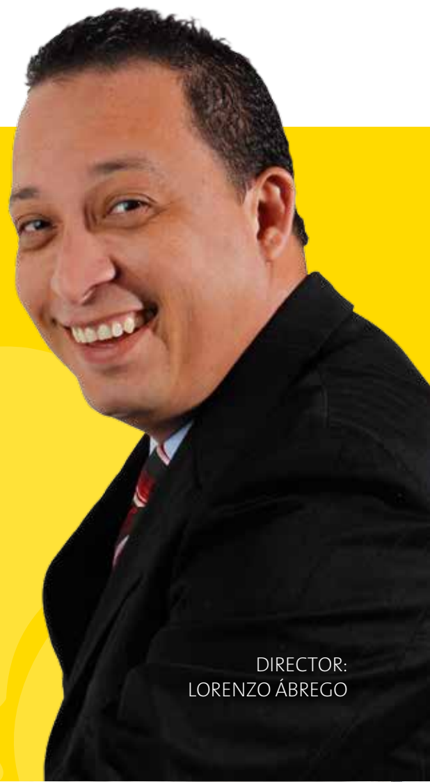
DIRECTOR: LORENZO ÁBREGO

También se apoyó a organizaciones sin fines de lucro, como lo son: La Fundación del Niño con Leucemia y Cáncer (Fanlyc) en la divulgaciones de sus programas, actividades a través de diversas notas editoriales de interés para el público. En el mes de agosto se realizó una gira para dar a conocer con reportajes especiales la situación de la población y los Objetivos de Desarrollo del Milenio ( ODM), allí se divulgó la situación que viven los indígenas de nuestras comarcas y se dio a conocer que muchas veces se violan sus