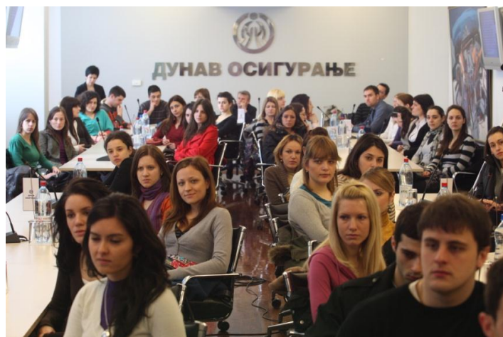
Apsolventi Ekonomskog fakulteta u poseti „Dunavu“

Kompanija pruža priliku mladima, pre svega studentima fakulteta i viših škola, da svoju obaveznu praksu obave u „Dunav osiguranju“. Na taj način dolazimo do najboljih pojedinaca koji poseduju odgovarajući profesionalni potencijal za rad i dalji razvoj karijere u Kompaniji.