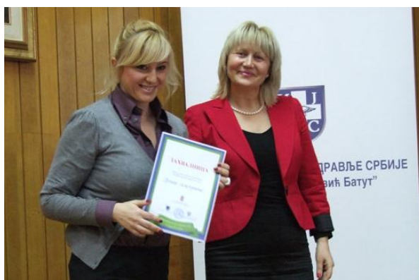
Kompaniji „Dunav osiguranje“ uručena zahvalnica povodom Nacionalnog dana bez duvanskog dima

Primećeno je i naše aktivno učešće u borbi protiv duvanskog dima, te je povodom obeležavanja 31. januara, Nacionalnog dana bez duvanskog dima, u Institutu za javno zdravlje Srbije „Dr Milan Jovanović Batut“ prošle godine održana konferencija za medije na kojoj je Kompaniji „Dunav osiguranje“ dodeljena zahvalnica jer je svojim promotivnim aktivnostima pružila podršku borbi protiv duvanskog dima.