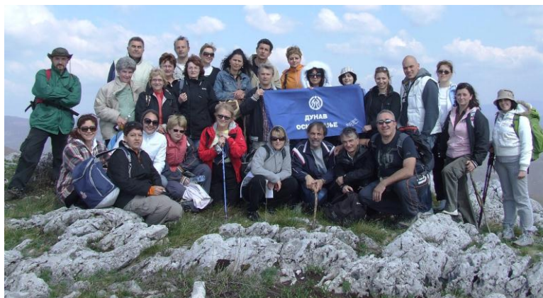
Planinari na vrhu Veliki Vukan na Homoljskim planinama