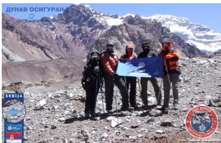
Članovi PKS „Dunav“ pred uspinjanje na Akonkagvu, najviši vrh Južne Amerike