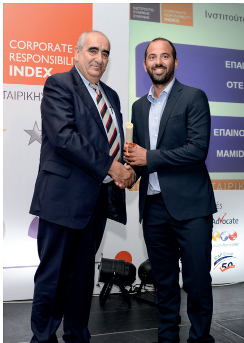
ΕΘΝΙΚΟΣ ΔΕΙΚΤΗΣ ΕΤΑΙΡΙΚΗΣ ΕΥΘΥΝΗΣ 2013 (CR Index*) GOLD

*Ο Εθνικός Δείκτης Εταιρικής Ευθύνης είναι ένα διεθνές εργαλείο αξιολόγησης