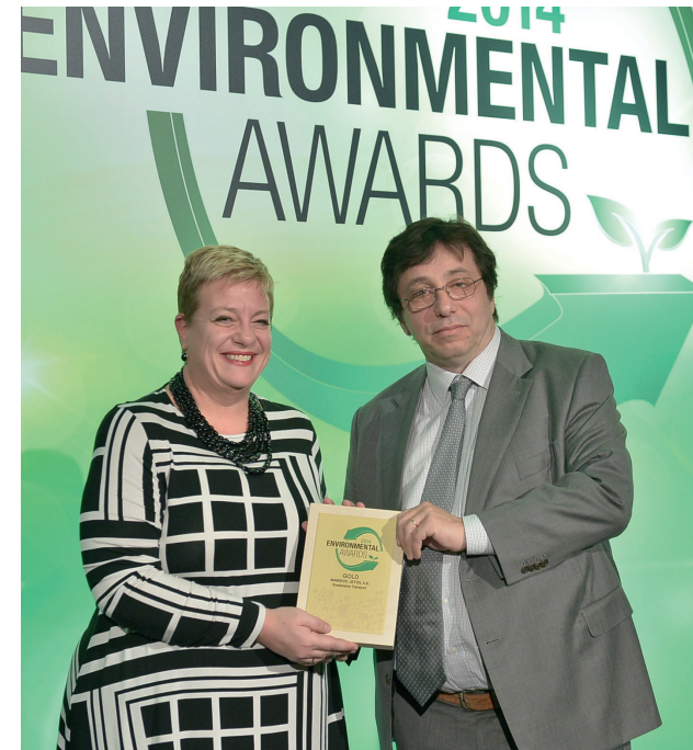
ENVIRONMENTAL AWARDS - GOLD στην κατηγορία SUSTAINABLE TRANSPORT (για το πρόγραμμα καταμέτρησης και αντιστάθμισης ρύπων όλων των μέσων που η εταιρεία χρησιμοποιεί για τη διακίνηση των εμπορευμάτων της σε στεριά και θάλασσα (βυτία και εφοδιαστικά πλοία)