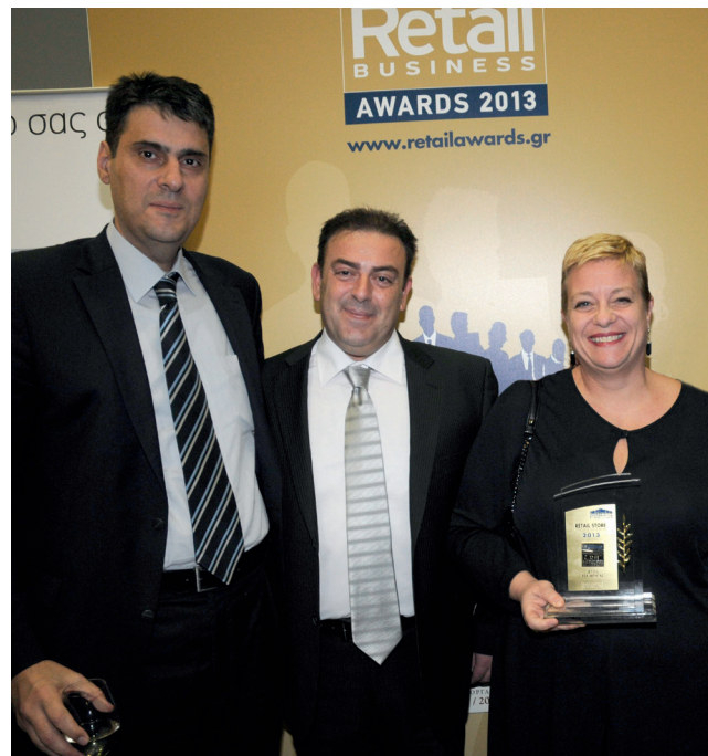
ΠΡΑΤΗΡΙΟ ΤΗΣ ΧΡΟΝΙΑΣ - JETOIL ΣΕΑ ΑΚΡΑΤΑ στα 12α RETAIL BUSINESS AWARDS 2013

*Ο Εθνικός Δείκτης Εταιρικής Ευθύνης είναι ένα διεθνές εργαλείο αξιολόγησης